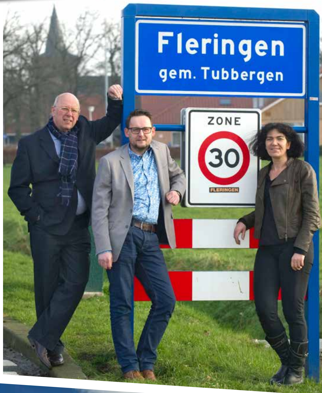
Werkgroep Mijn Fleringen 2030

"Maar we zien het ook wel als een kans. Je wilt een vitaal dorp houden, ook in 2030. We moeten de kans grijpen om op deze ontwikkelingen in te spelen. Vaak leven we in de waan van de dag. Nu worden we gedwongen om na te denken over de toekomst."