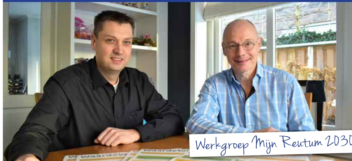
Werkgroep Mijn Reutum 2030