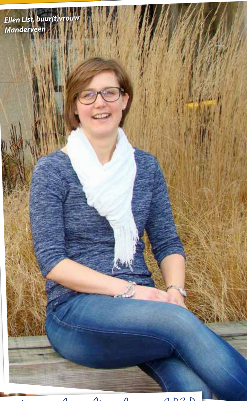
Werkgroep Mijn Manderveen 2030