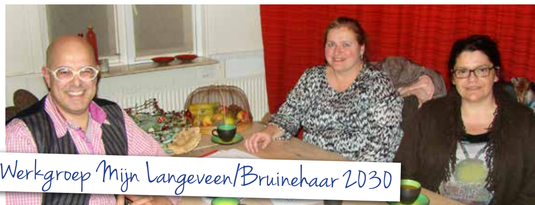
Werkgroep Mijn Langeveen/Bruinehaar 2030