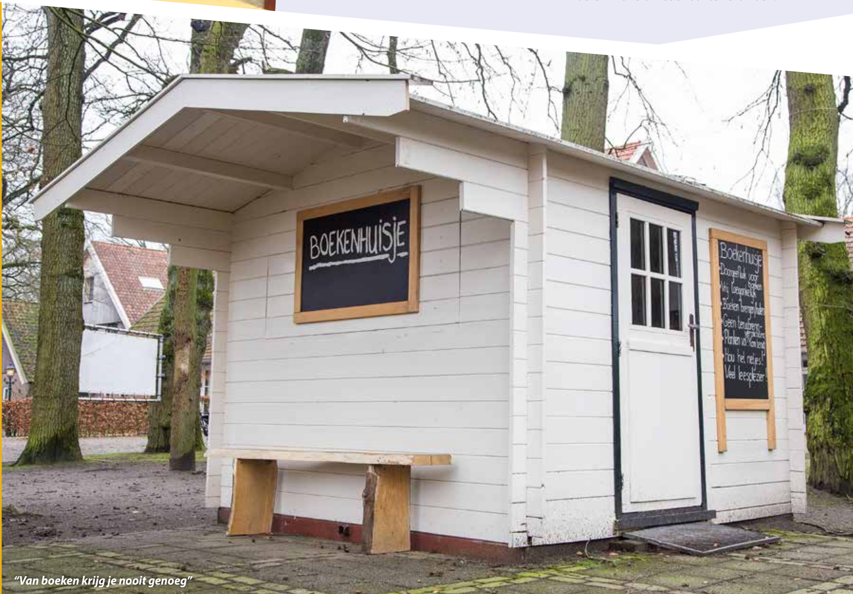
“Van boeken krijg je nooit genoeg”

Lid worden is niet nodig, en terugbrengen hoeft ook niet. Als je een boek vindt dat je wil lezen, neem je het mee. Heb je zelf nog boeken in de kast die je niet meer in kijkt? Dan kun je ze naar het boekenhuisje brengen. Zo is er in Vasse een wereld aan boeken voor iedereen!